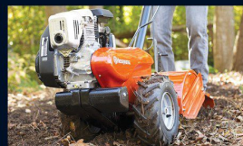
Садовая техника и инвентарь

Технология ШТОРМПРОФ с использованием биоразлагаемых очистителей соответствует требованиям промышленной и экологической безопасности не только для оборудования, но и для персонала.