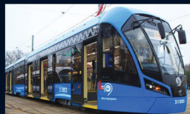
Мосгортранс и Горэлектротранс