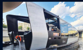
Морской транспортный и речной флот