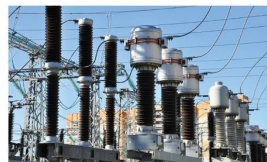
Электроэнергетика и электротехника