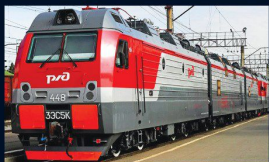
Российские железные дороги