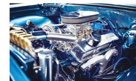
Автохимия и автокосметика